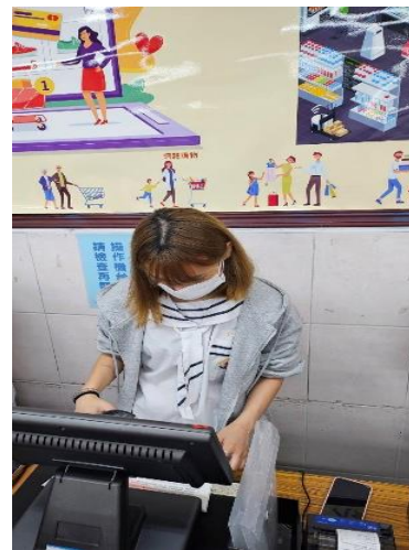
說明：「門市經營實務」POS 收銀機實作。