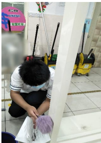
說明：「門市經營實務」玻璃清潔實作。