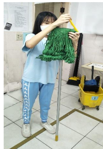
說明：「門市經營實務」地板清潔實作。