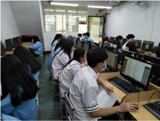
說明：一年級「數位科技概論」電腦操作。