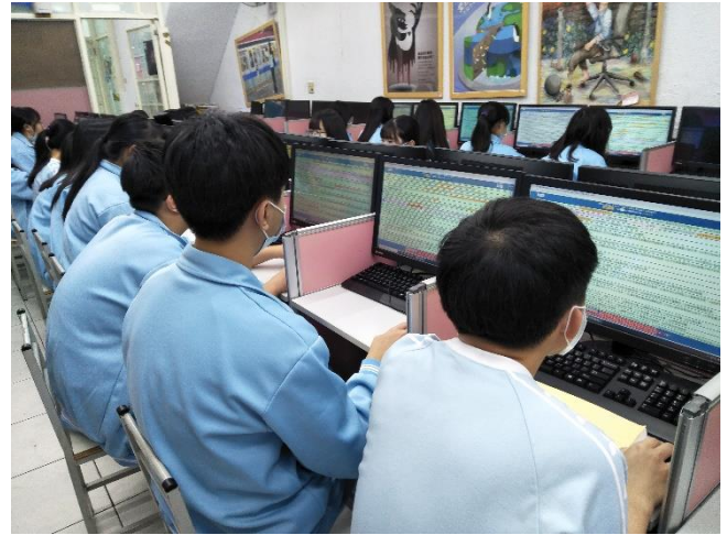
說明：二年級「數位科技應用」電腦操作。