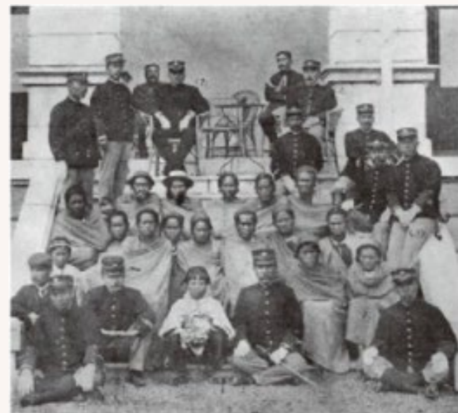
⊕ 佐久間總督於臺北官邸接見觀光蕃人的狀況