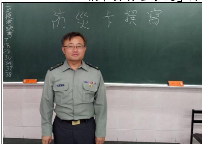
說明：運用班會時間由教官宣導