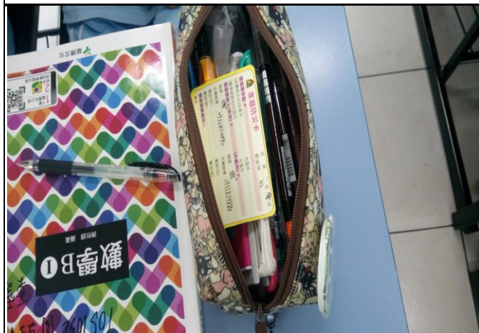
說明：家庭防災卡置於學生鉛筆盒內