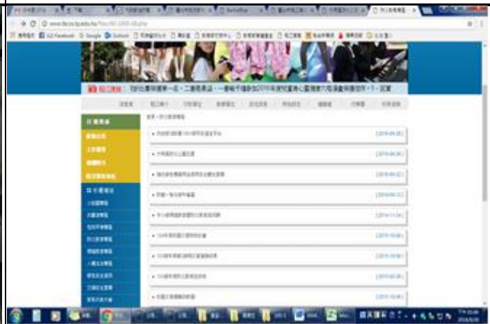
說明：本校防災專區 1991 平安留言平台宣導