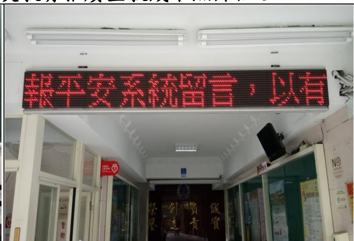
說明：運用跑馬燈宣導報平安系統留言