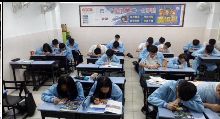
說明：同學填寫家庭防災卡