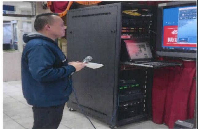
照片4：防災演練-通報地震發生。