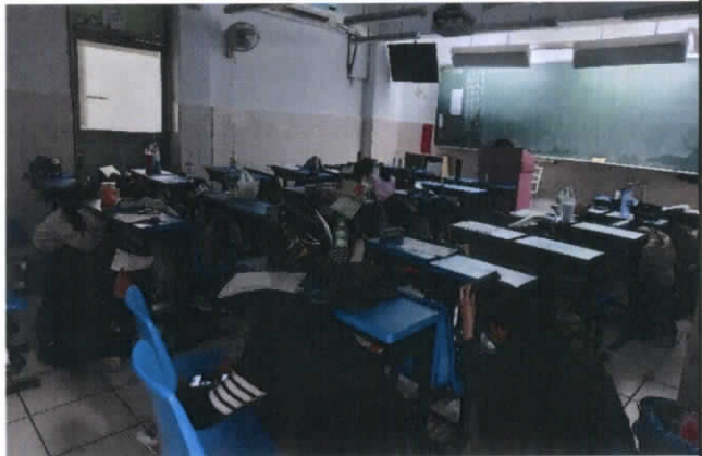
照片6：防災演練-趴下、掩護、穩住。