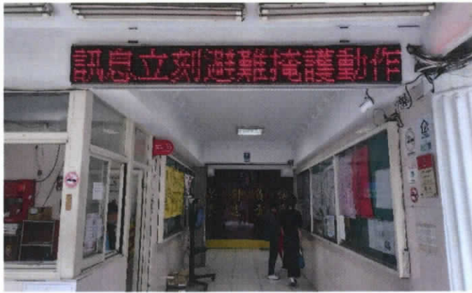
照片1：防災演練宣導。