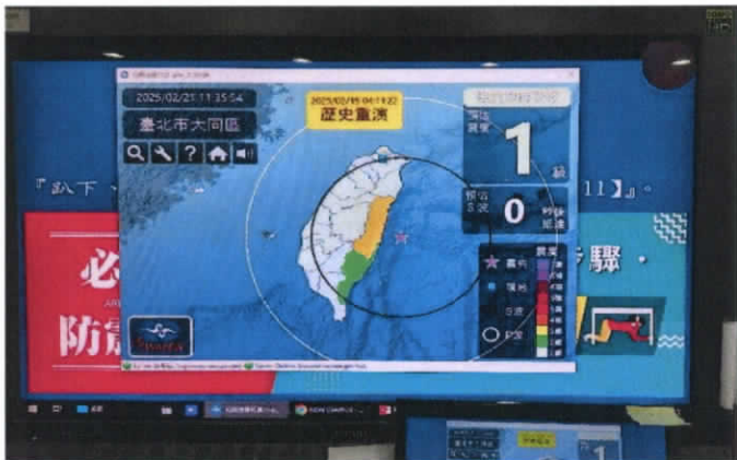
照片3：防災演練-地震速報警報發報測試。