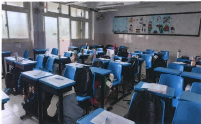
照片5：防災演練-趴下、掩護、穩住。