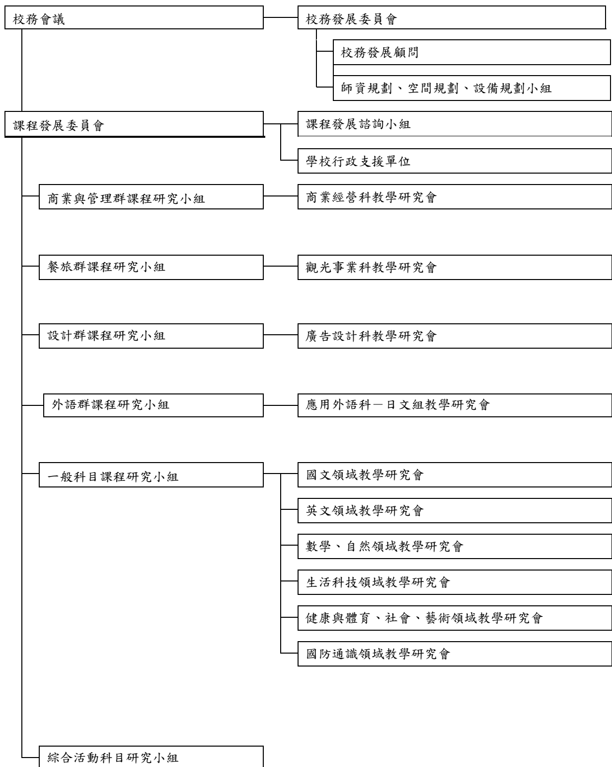
圖 2-2-1 課程發展組織架構圖