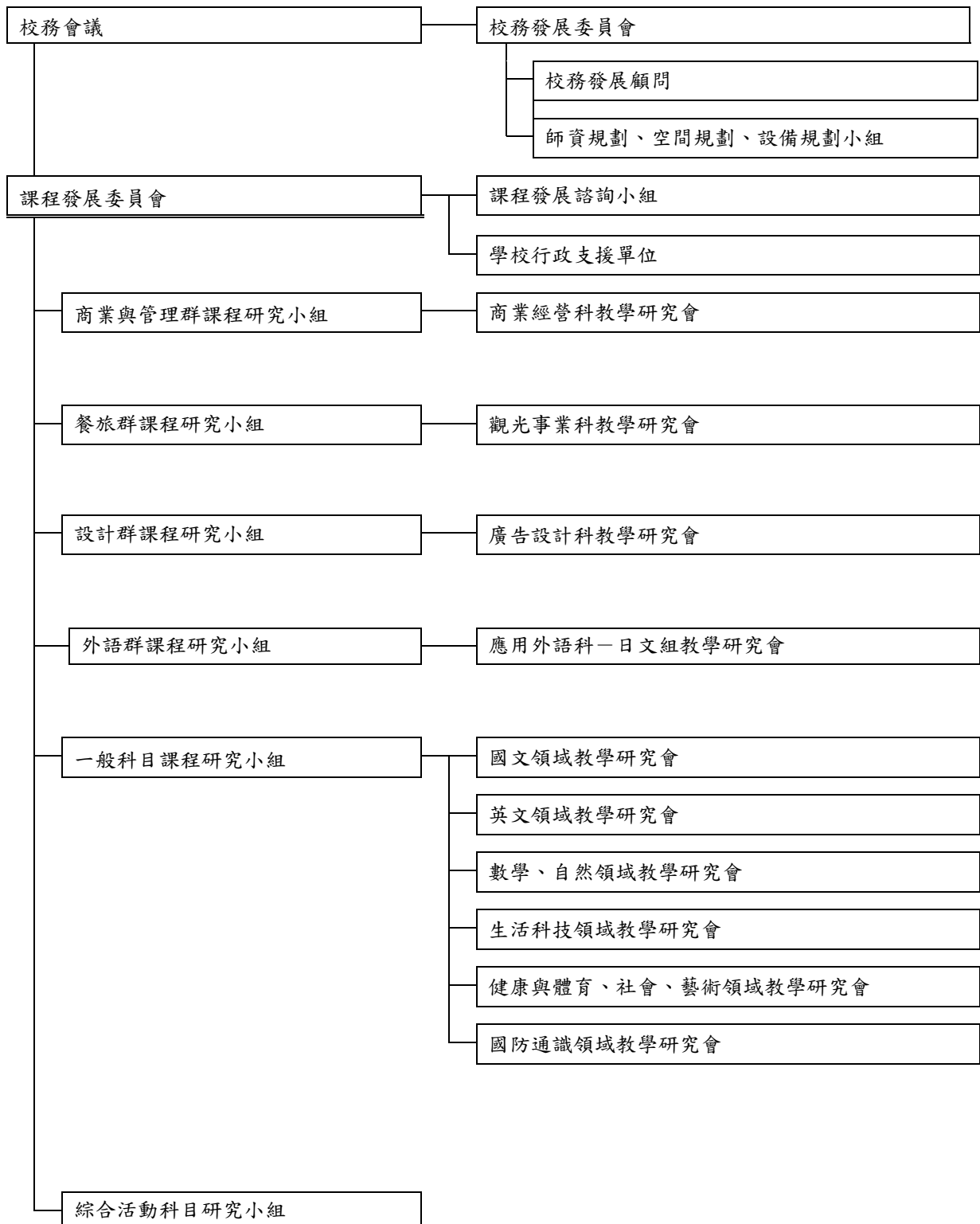
圖 2-2-1 課程發展組織架構圖