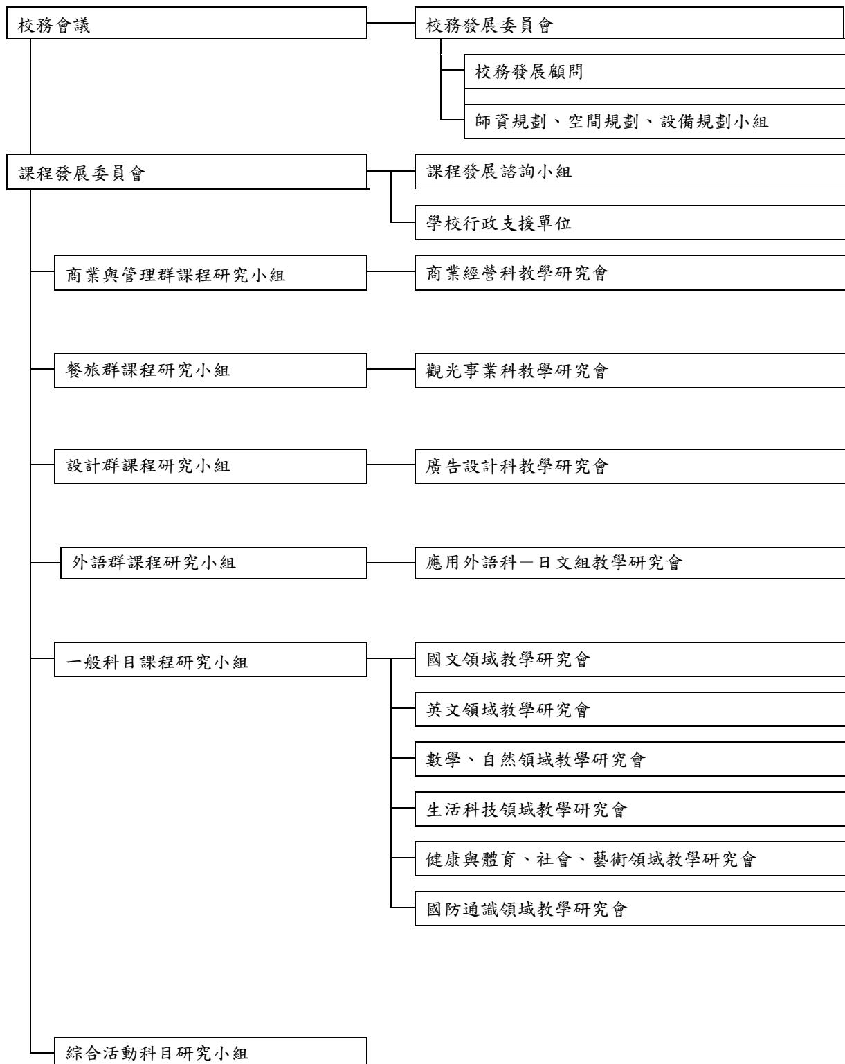
圖 2-2-1 課程發展組織架構圖